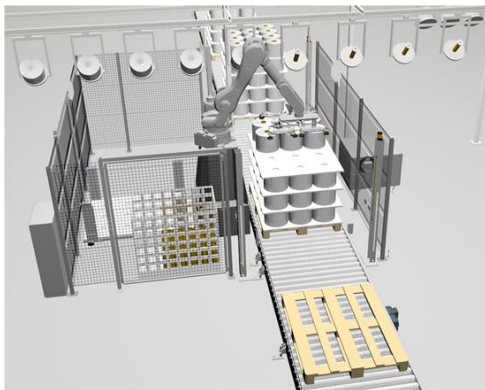
BCF 纱和帘子线生产换筒时,轨道系统上的自动装载装置

卓郎集团是一家专注于纱线加工机械和专件的全球领先运营技术集团。作为一家拥有悠久传承的公司,卓郎一直在引领行业创新。卓郎目前下设两大事业部,纺纱事业部和技术事业部。纺纱事业部为从棉包到纱线的短纤加工提供技术先进的客户定制高品质自动化方案。技术事业部专门提供加捻和刺绣以及工程和聚合物方案。实现年度销售收入 11.8 亿欧元(合 92.2 亿元人民币),拥有 4 700 名员工,业务遍布瑞士、德国、土耳其、巴西、墨西哥、美国、中国、印度和新加坡,这家发展势头强劲的集团已经处在服务全球纺织行业的核心地位。卓郎集团在上海证券交易所上市。(证券代码:600545。) www.saurer.com .